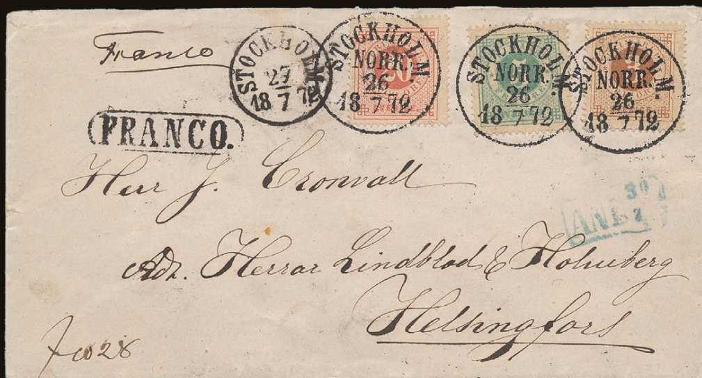
Ett av svensk filatellis vackraste klassiska brev