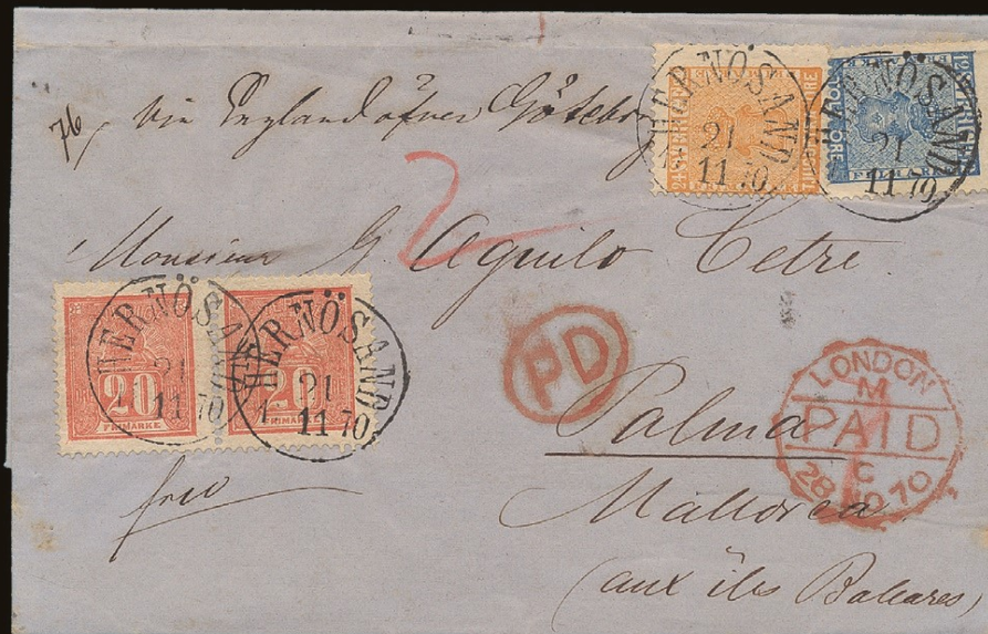
Unikt brev till Mallorca