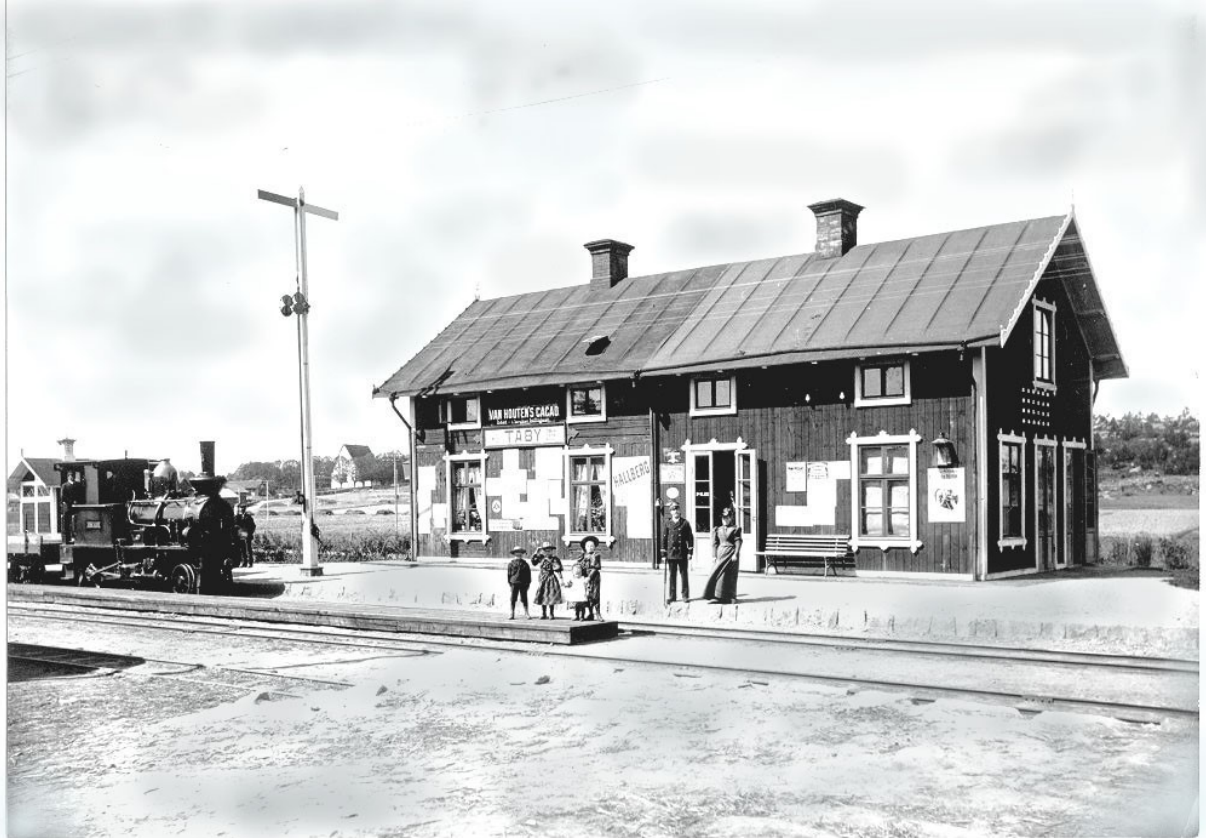
Den förenade post- och järnvägsstationen i Täby Kyrkby utmed Roslagsbanan Stockholm-Rimbo. Obs. reklamskylden Van Heutens Cacao på stationsbyggnaden. Möjligen tidigt exempel på intäkter från reklam.