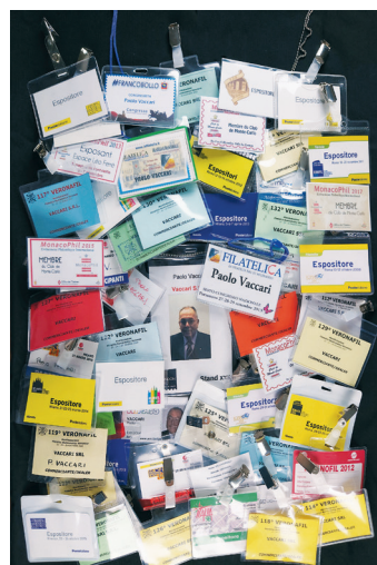
2022 - Anni di convegni, manifestazioni e incontri.