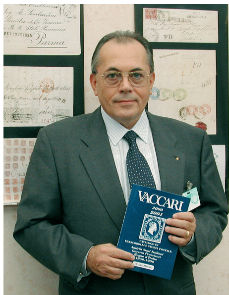
2000 - Presentazione del Catalogo "Francobolli e storia postale. Antichi Stati Italiani, Governi Provvisori, Regno d'Italia 1850-1900" a Ravenna.