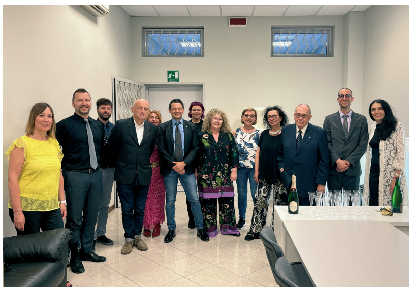
2022 - Lo staff Vaccari nel consueto brindisi di fine asta dell'11 giugno 2022.