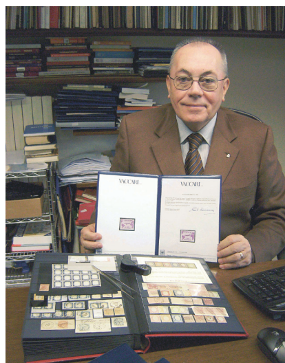
2011 - Nel suo ufficio nella nuova sede della "Vaccari srl".