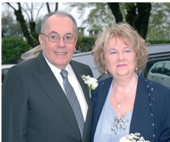
Cinquanta anni di matrimonio.