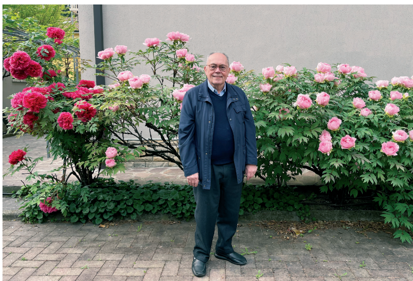
2022 - Tra le sue amate peonie.