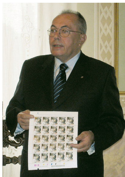
2007 - Con il foglio del francobollo dedicato al famoso architetto vignolese Jacopo Barozzi a 500 anni dalla nascita, di cui ha scritto il bollettino illustrativo.